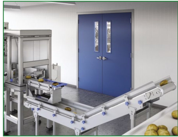
Toutes les portes planes en fibre de verre sont approuvées par la FDA/USDA